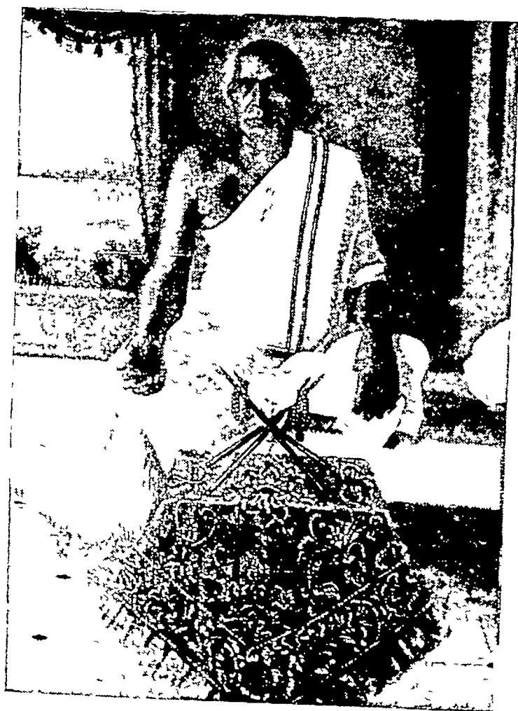
आचार्य १००८ श्री जिनरिद्धिहरीश्वरजी म. सा.